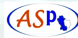
Azienda Sanitaria Locale di Potenza